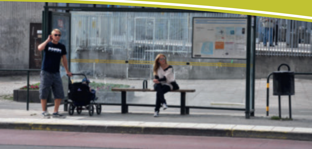
Resanden som väntar